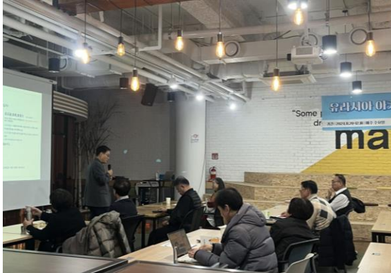
유라시아 아카데미 7기 강의 현장